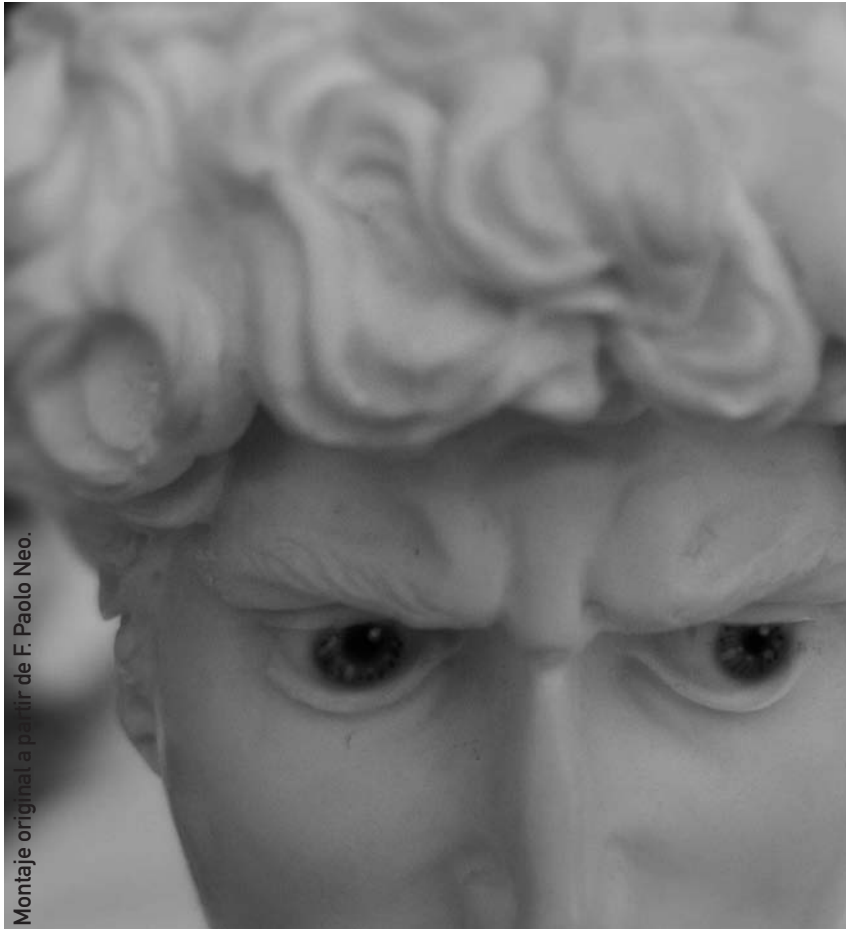
Montaje original a partir de F. Paolo Neo.

ESO apoyándose en la doctrina jurisprudencial existente sobre la naturaleza del complemento espe-