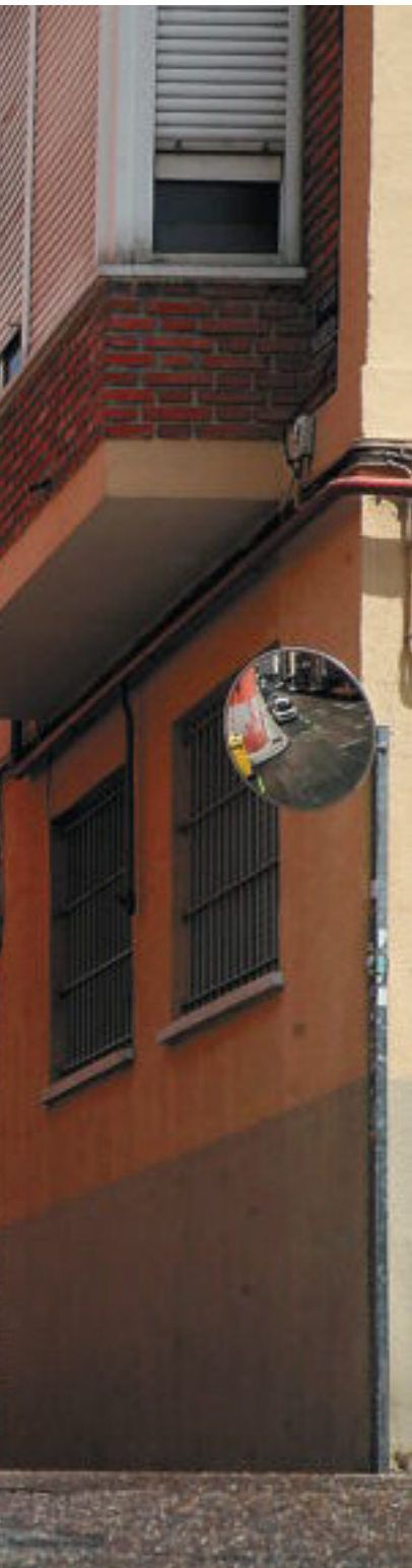
La situación en España es similar al resto de Europa, mejor que Italia y Portugal, peor que Reino Unido y Escandinavia.

posibilidad de que el hijo de un obrero poco cualificado llegue a ser directivo es mayor que la que tiene el hijo de un trabajador español. “En España se produce un ejemplo marcado de lo que Max Weber llama cierre de clase. Las élites intentan mantener sus privilegios subiendo los requisitos para entrar en ellas”, dice Marqués.