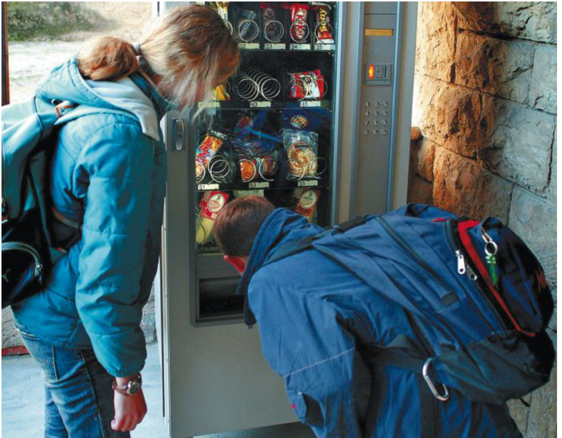
Las máquinas expendedoras de los colegios públicos no podrán vender alimentos de más de 200 calorías. Se priorizará la venta de fruta cortada.