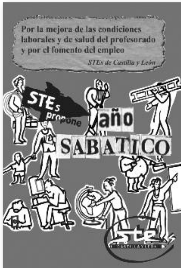
Cartel de STECyL 2001-2002.

La Orden contempla el mismo modelo de permiso que el acordado otras CCAA: se enmarca en un periodo de cinco cursos escolares consecutivos; durante los cuatro primeros se trabaja a jornada completa, cobrando el 85% de la nómina y durante el quinto curso se disfruta del permiso (no se trabaja), percibiendo el mismo porcentaje. Esto significa que el propio docente se financia el 60% y la Consejería aporta un 25% de las retribuciones del año sabático. En el resto de Comunidades la aportación de las respectivas Consejerías es del 20%.